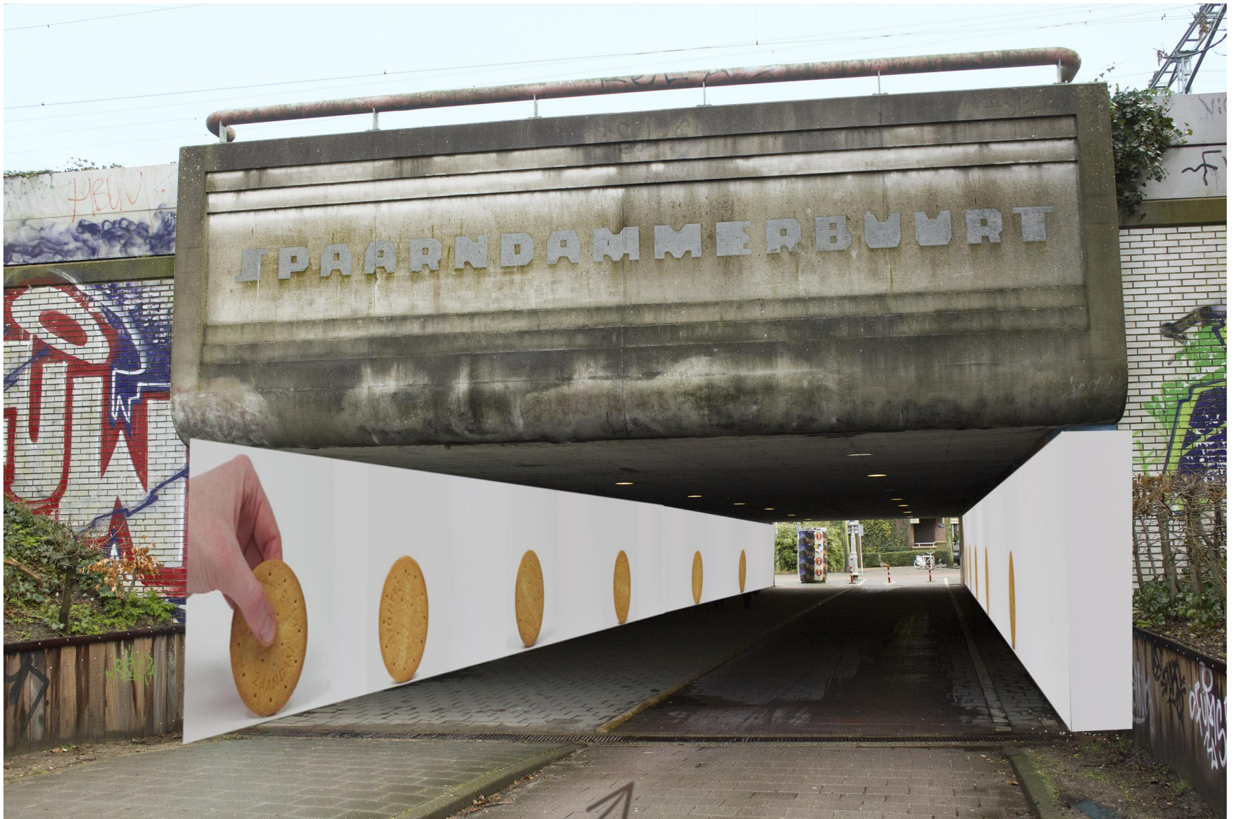
De tunnel komt uit op de Zaanstraat. De Zaanstreek staat niet alleen bekend om zijn molens, maar ook om zijn koekjes. Vandaar de keuze voor de koekjes.